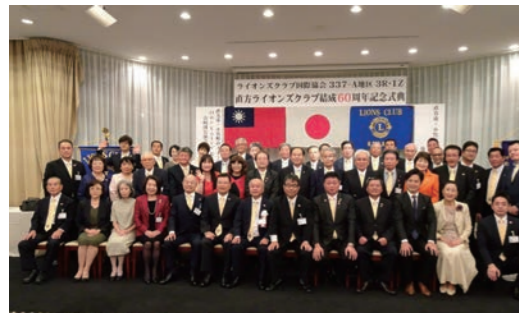
※結成60周年記念式典の写真