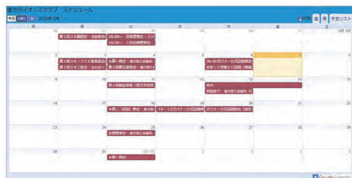
●一ヶ月のスケジュールがまとめて表示されます